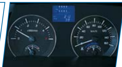
Tablero de fácil lectura