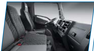
Cómoda cabina full equipo